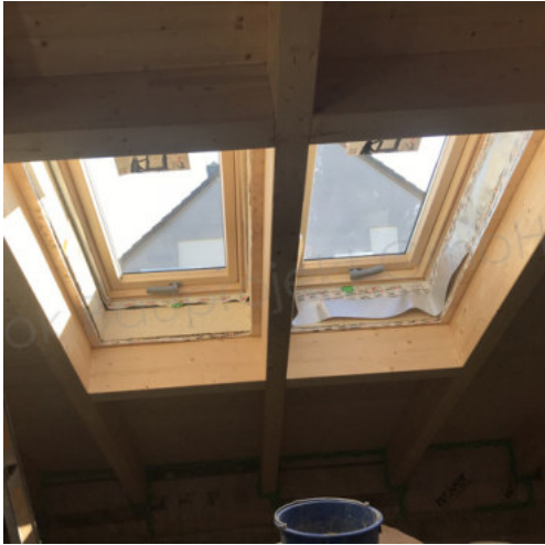
43: Einsetzen der Dachflächenfenster