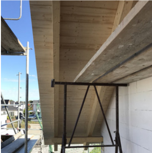
31: Anbringen der fl.-deckenden Dachschalung