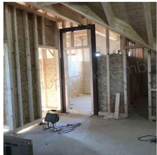
40: Beplanken der Holz-IW mit OSB-Platten