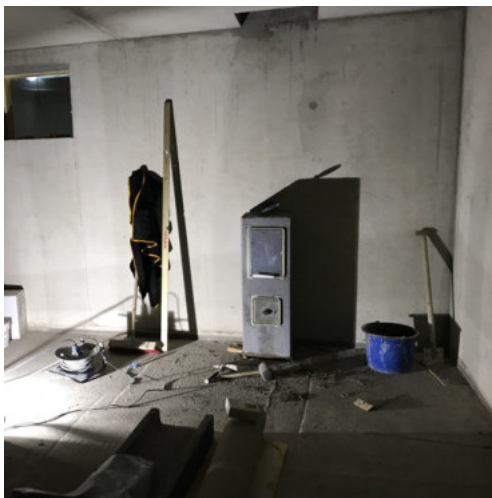
33: Aufstellen des Schornsteins KG