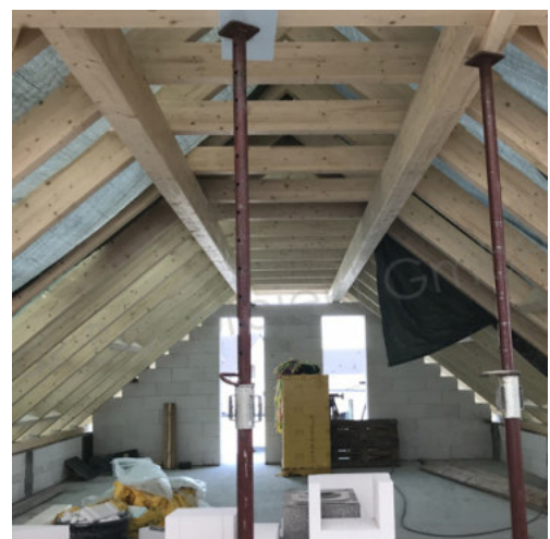
30: Aufbringen der Dachabdichtung