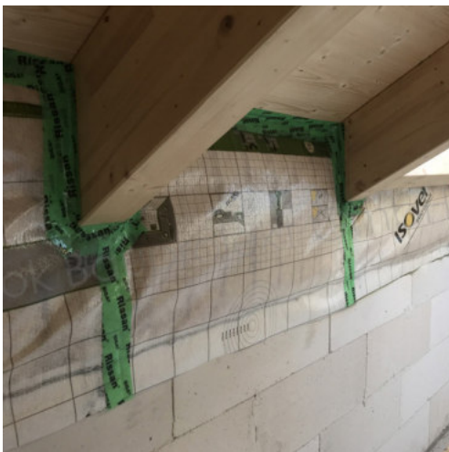
41: Abdichten der Übergänge Sparren-Drempel