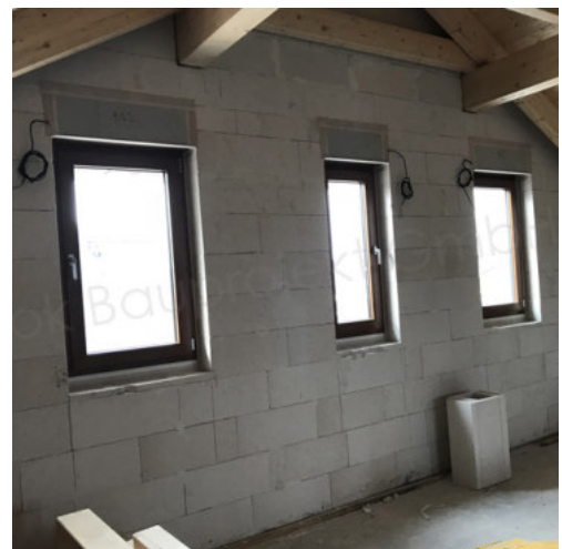
36: Einbau der Fenster mit elekt. Rollläden