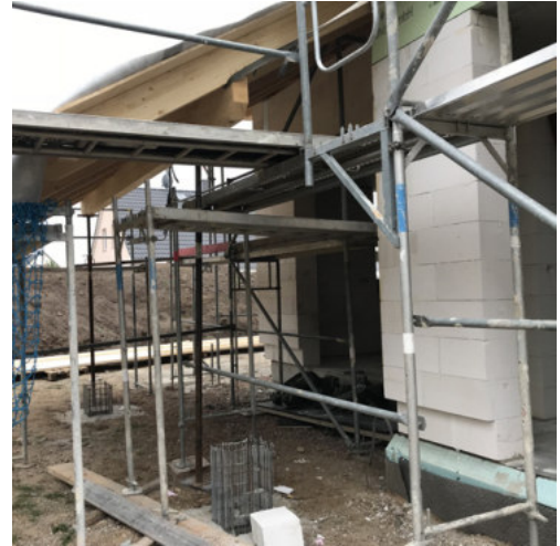
32: Bewehren & Betonieren der Einzelfundamente