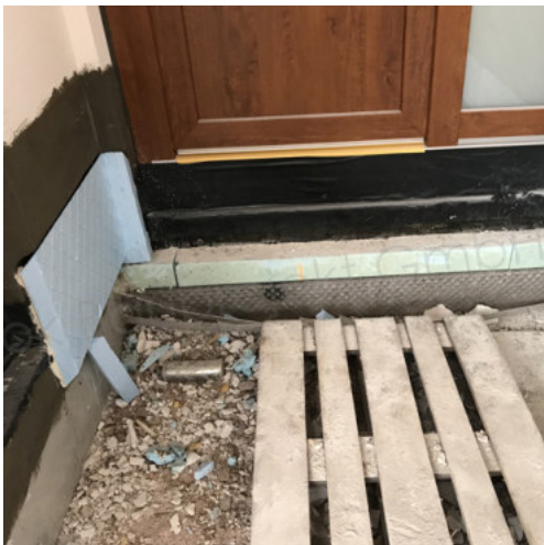
47: Dämmen des Sockelbereiches