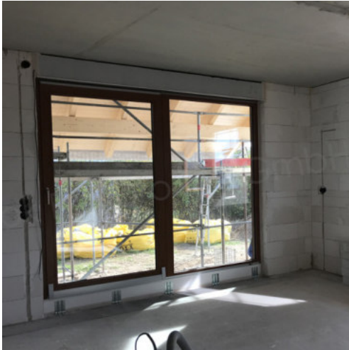
37: Schlenzarbeiten EG