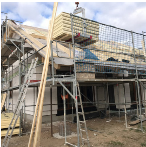
35: Verlegen der Aufsparrendämmung