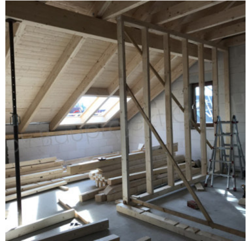
38: Aufbau der Holzständerwände DG