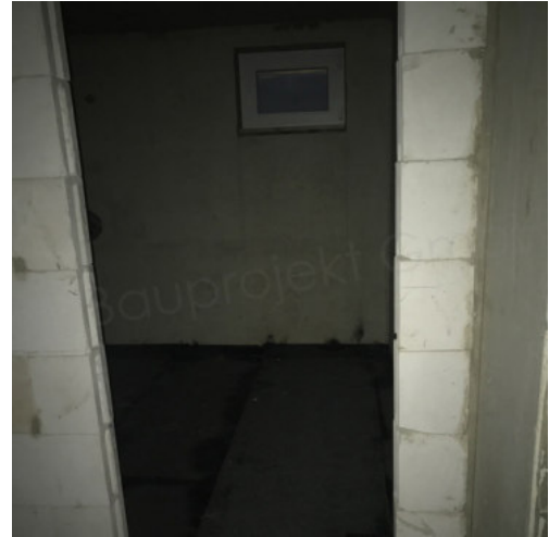
44: Abdichten der Bodenplatte KG