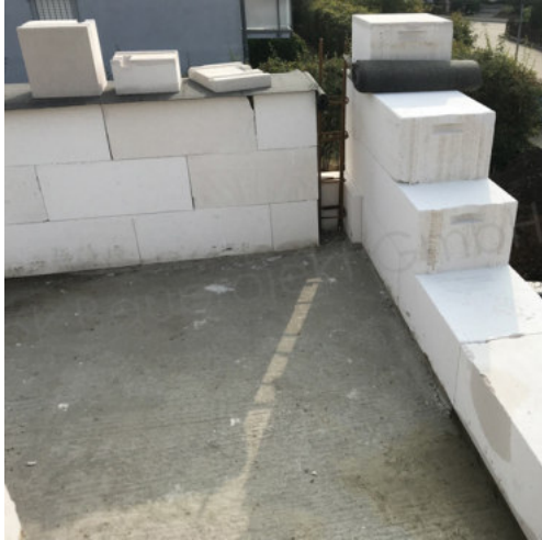
25: Beginn Mauerarbeiten AW OG