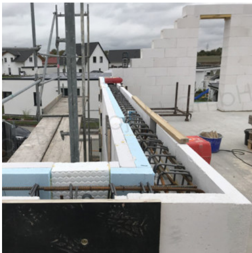
27: Bewehren der Drempel