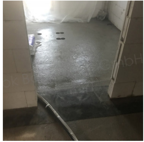
46: Kernbohrungen EG zu KG für Haustechnik