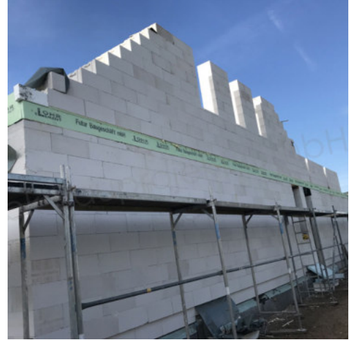
26: Mauerarbeiten Giebel & Drempel