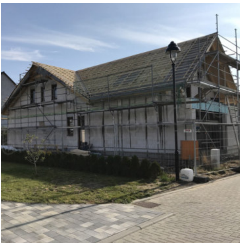
39: Fertigstellen der Dachlattung