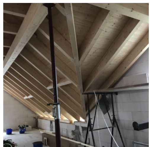
34: Fertigstellen der Dachschalung