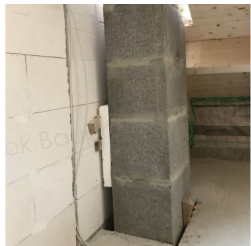
48: Aufmauern des Schornsteines