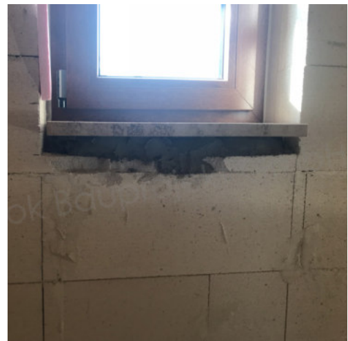
42: Einsetzen der Innenfensterbänke