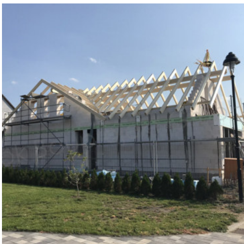
29: Richtfest Ansicht Nord