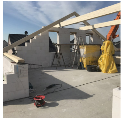
28: Beginn Setzen des Dachstuhl